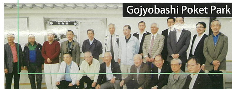
Gojobashi Poket Park

事務局／ 〒460-0008 名古屋市中区栄二丁目10-19 名古屋商工会議所ビル9F TEL 052-201-2201 FAX 052-210-3601 https://www.aichishikai.or.jp