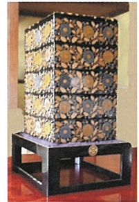
佐助翁ゆかりの品々