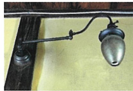
ガスランプシェード