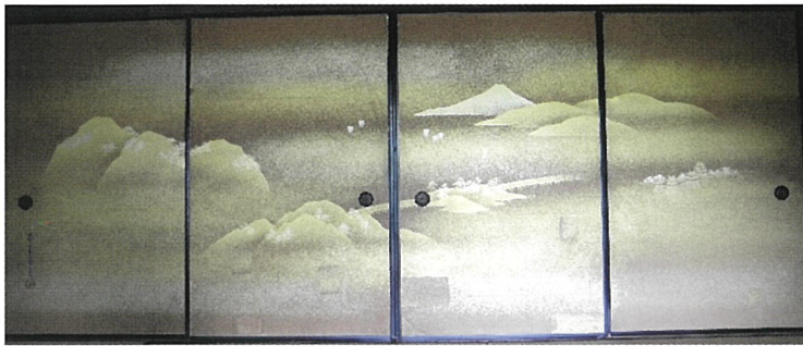
金彩ふすま絵 好文作