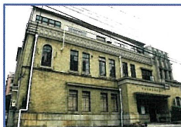
名古屋陶磁器会館

名古屋市市政資料館－文化のみち榎木館＊－名古屋陶磁器会館 (*入館します、別途入館料必要)