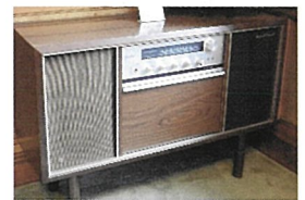
TOYOTA ブランド HiFi ステレオセット