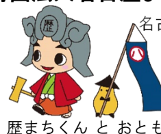
歴まちくんとおとも

E-mail:a2779@kankobunkakoryu.city.nagoya.lg.jp